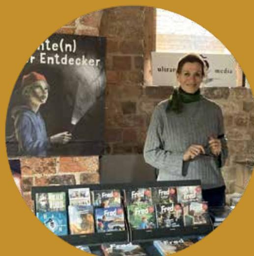
... beim ersten Berlin-Brandenburgischen Bücherfest in Kloster Chorin