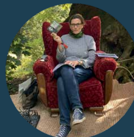
„Robin Hood“ unter der 500 Jahre alten Eiche in Kloster Chorin