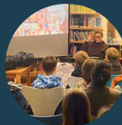
... im Lesetreff Waldbronn