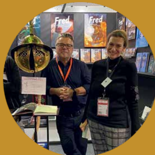
ultramar auf der Frankfurter Buchmesse ...