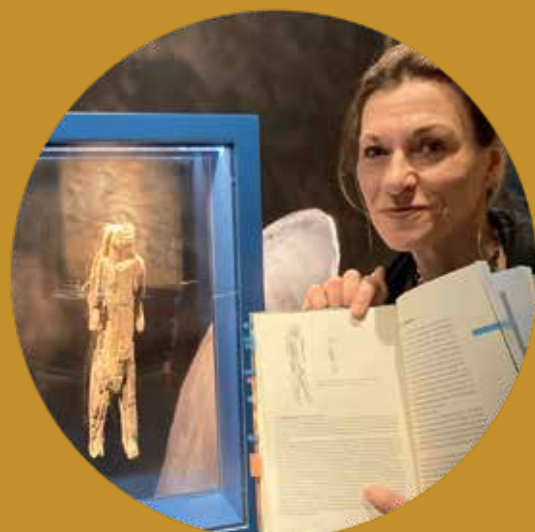
... in der archäologischen Staatssammlung München