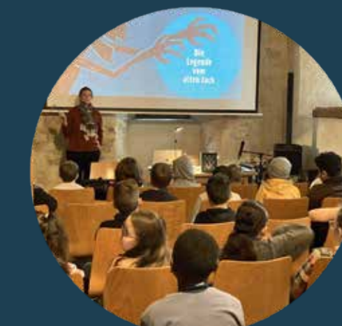
„Halloween“ in der Stadtbibliothek Blaubeuren