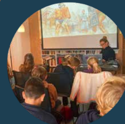
Premierenlesungen von „Fred im alten Rom“ im Römermuseum Remchingen ...