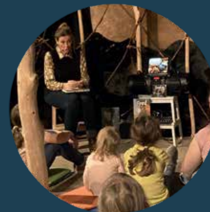
„Fred in der Eiszeit“ in der Sonderausstellung „Eiszeit“ in Kempten