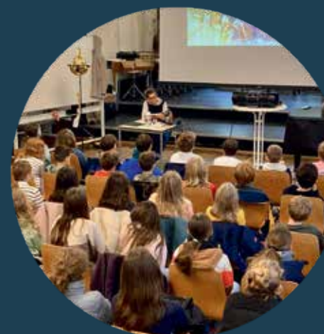
... und im Gymnasium Hohenbaden in Baden-Baden